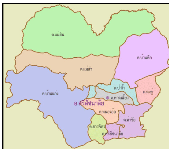
แผนภาพที่ 1 แผนที่แสดงพื้นที่อำเภอศรีสัชชนาลัย